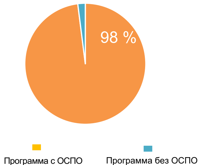
Доля программ с использованием ОСПО на рынке